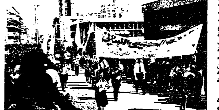
المسيرات في صيدا امس

صيدا - الانوار: كتفتها كل علم احث صيدا امس الذكرى الخامسة عشرة لغيب نائلها وفلاها الخاضع لمعروف سعد في مسيرة وفاة ضخمه. انطلقت من امام مقر صيدا للشرطة في صيدا واخرقت شوارعها الرئيسية حامله الاعلام اللبنانية واعلام التنظيم الشعبي الناصري والاعلام التضامني.